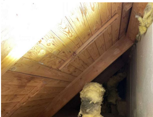
Bild 4: Invändigt, Övervåning, Sidovind 1 och 2, Lokalt på sidovinden noteras det mikrobiell påväxt på underlagstaket Vindarna är besiktigade från luckan