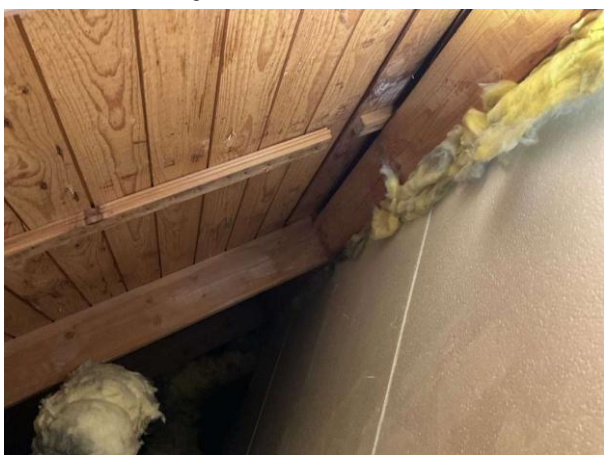
Bild 5: Invändigt, Övervåning, Sidovind 1 och 2, Lokalt på sidovinden noteras det mikrobiell påväxt på underlagstaket Vindarna är besiktigade från luckan