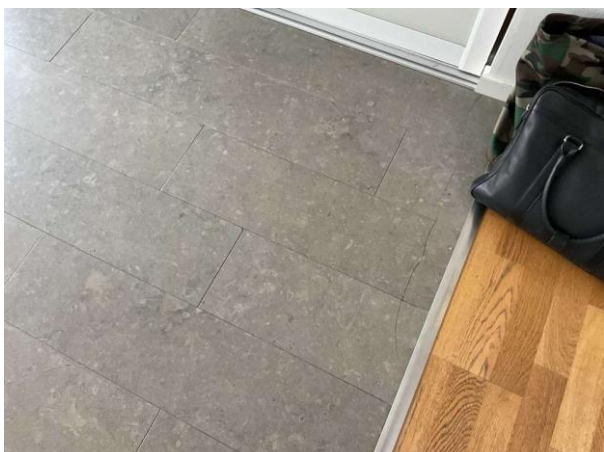
Bild 1: Invändigt, Entréplan, Entréhall, Spricka noteras på klinker