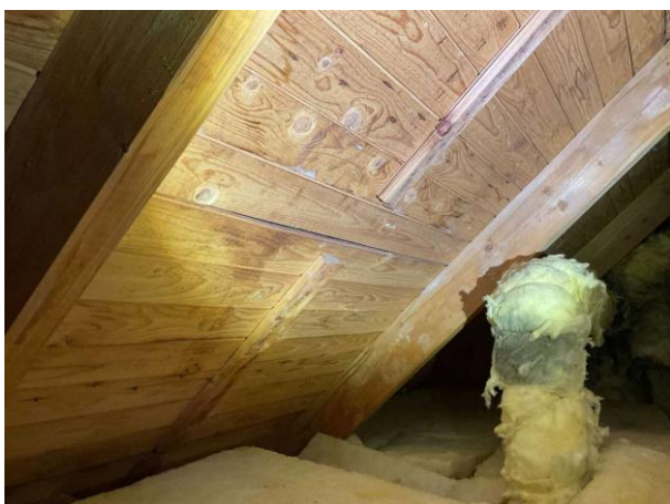
Bild 3: Invändigt, Övervåning, Sidovind 1 och 2, Lokalt på sidovinden noteras det mikrobiell påväxt på underlagstaket Vindarna är besiktigade från luckan