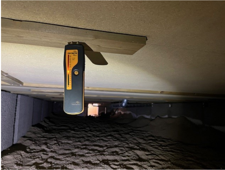
Fuktmätning i krypgrunden.