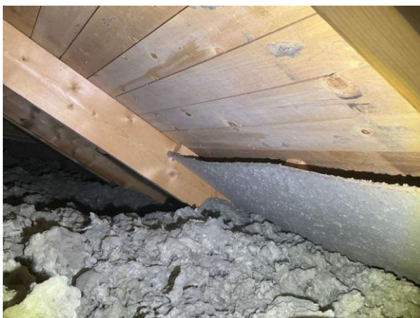
Bild 2: - Utvändigt, Vind, Parallelliserade /snedtak ej besiktningsbart utrymme Vinden är besiktad från lucka Lokalt noter...