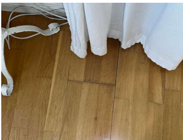
Bild 4: Invändigt, Entréplan, Svällskada missfärgning noteras på parketten (se säljuppsning)