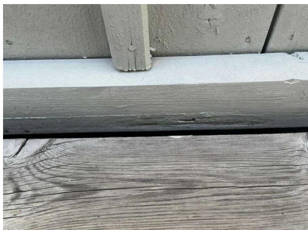
Bild 1: - Utvändigt, Fasad, Äldre torrsprickor noterades på panelen Lokalt noteras det en rötskadad list ovan träpanel på bak...