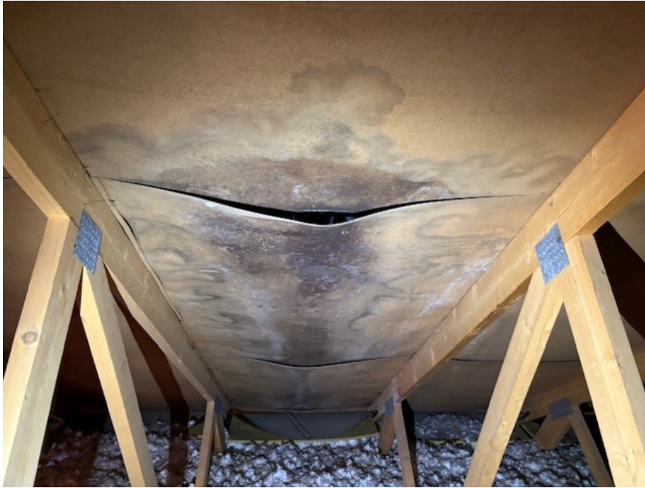
Lokal skada i underlagstaket /masonit på vind, se tidigare skador.