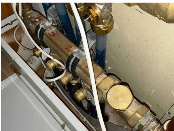
Bild 3: Invändigt, Övervakning, Tät botten med läckageindikering saknas i inbyggnad för vattenkopplingar