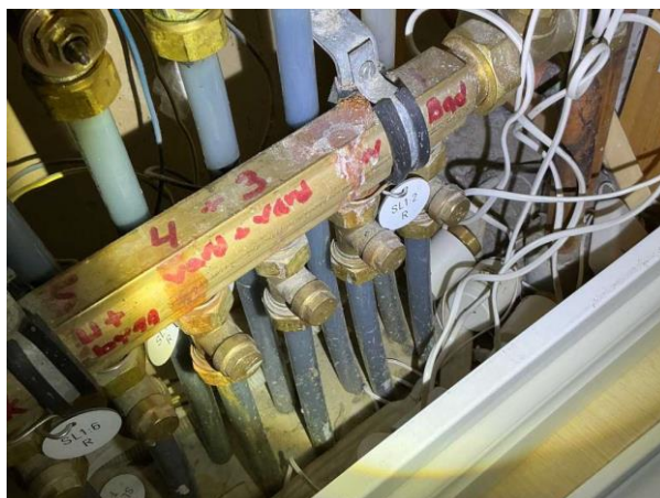
Bild 2: Invändigt, Entréplan, Tät botten med läckageindikering saknas i inbyggnad för vattenkopplingar