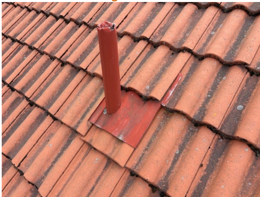
Äldre plåtinklädnad kring avloppsluftning.