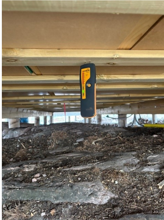
Fuktmätning i plintgrunden.