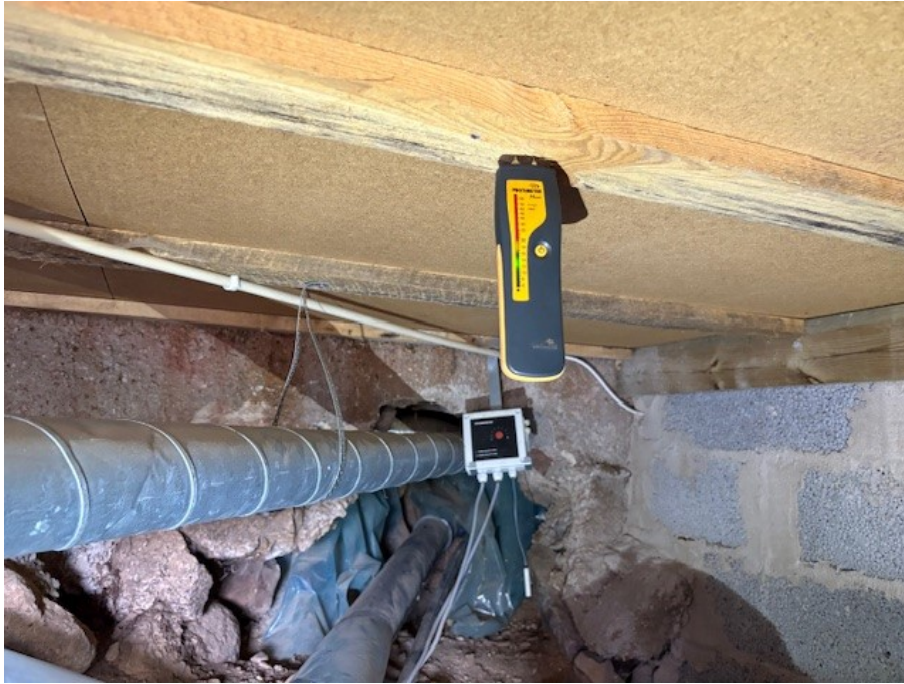
Fuktmätning i krypgrunden under tillbyggnad.