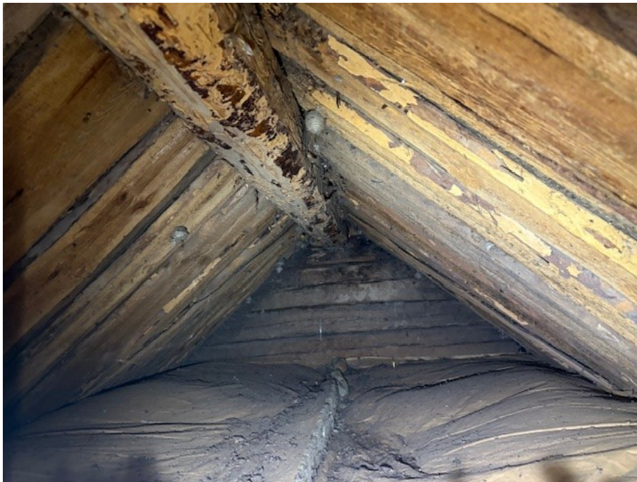
Nockvind via lucka.