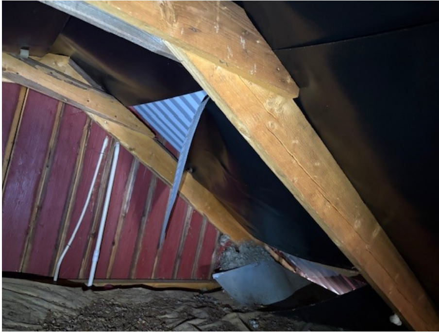
Underlagstak/Tenonoduk på garagedelen som släppt i från sin infästning.