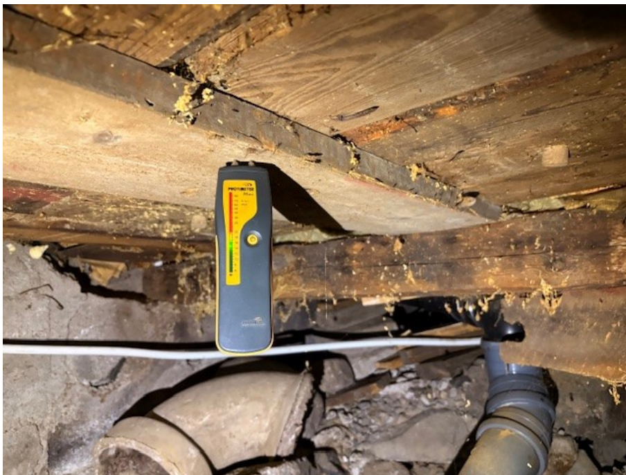
Fuktmätning i torpargrunen. Vissa rötangrepp i den synliga stocken (bärande delar).