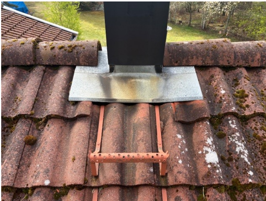
Bristfälligt överlapp på plåtinklädnad kring skorstenens genomföring, detta skall åtgärdas av nuvarande ägare.