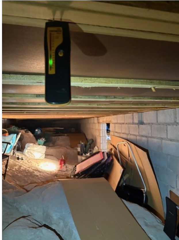
Fuktmätning i krypgrunden.