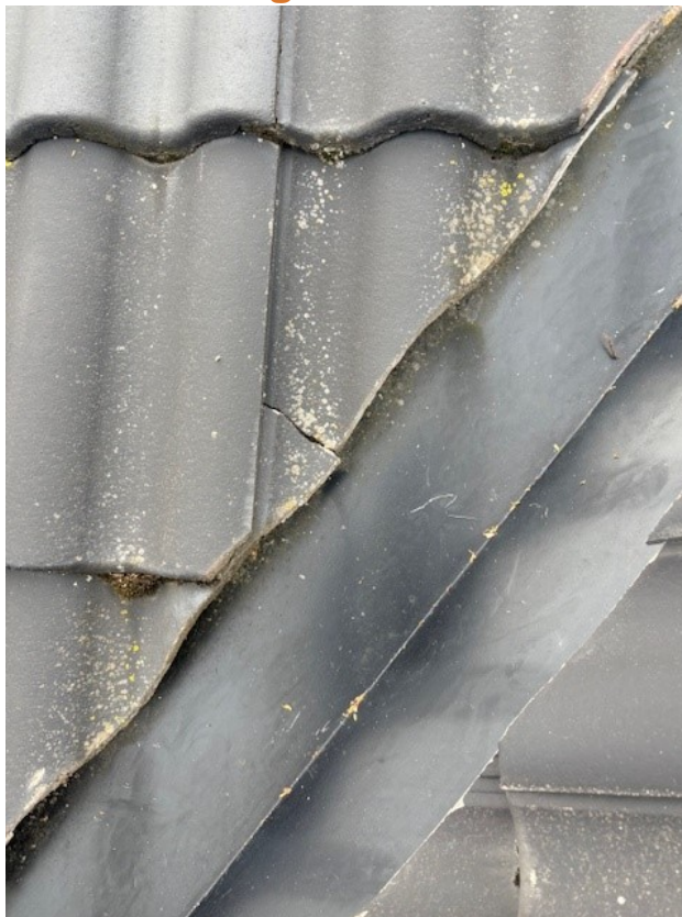
Skadad takpanna vid rännal.