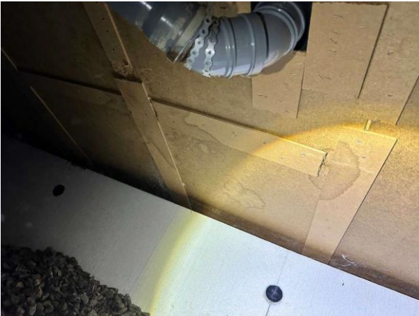
Bild 3: - Utvändigt, Krypgrund, Uteluftventilerad krypgrund är en känd riskkonstruktion, se riskanalys. För att denna grundläggning...