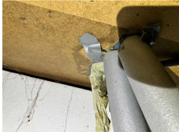
Bild 2: - Utvändigt, Krypgrund, Uteluftventilerad krypgrund är en känd riskkonstruktion, se riskanalys. För att denna grundläggning...