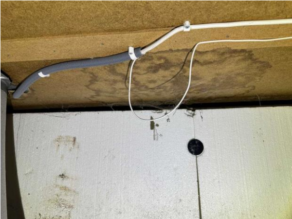
Bild 1: - Utvändigt, Krypgrund, Uteluftventilerad krypgrund är en känd riskkonstruktion, se riskanalys. För att denna grundläggning...