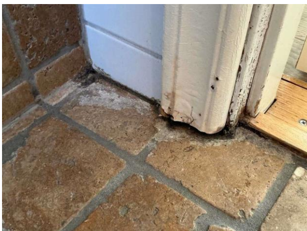
Bild 7: - Invändigt, Övervakning, Renovering ca 2012 Begränsat besiktat under badkar via lucka Röret under badkaret har lossnat oc...