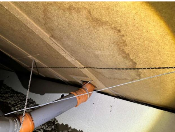
Bild 5: - Utvändigt, Krypgrund, Uteluftventilerad krypgrund är en känd riskkonstruktion, se riskanalys. För att denna grundläggning...