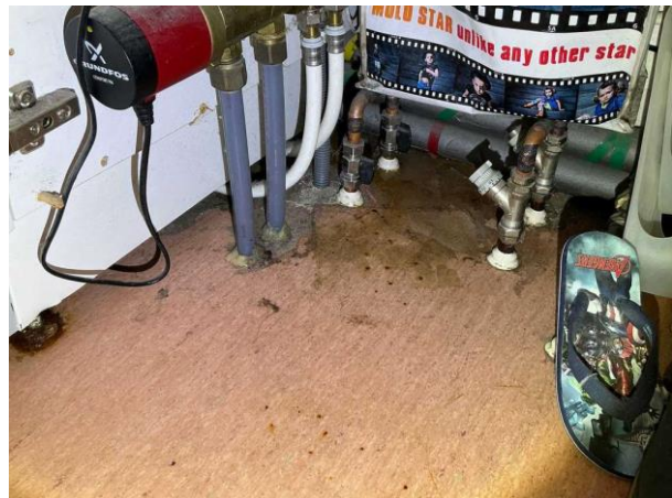
Bild 6: - Invändigt, Entréplan, Äldre våtrum se riskanalysen Ytterdörr ej tät Det förekommer rörgenomföringar i golv annat än för...