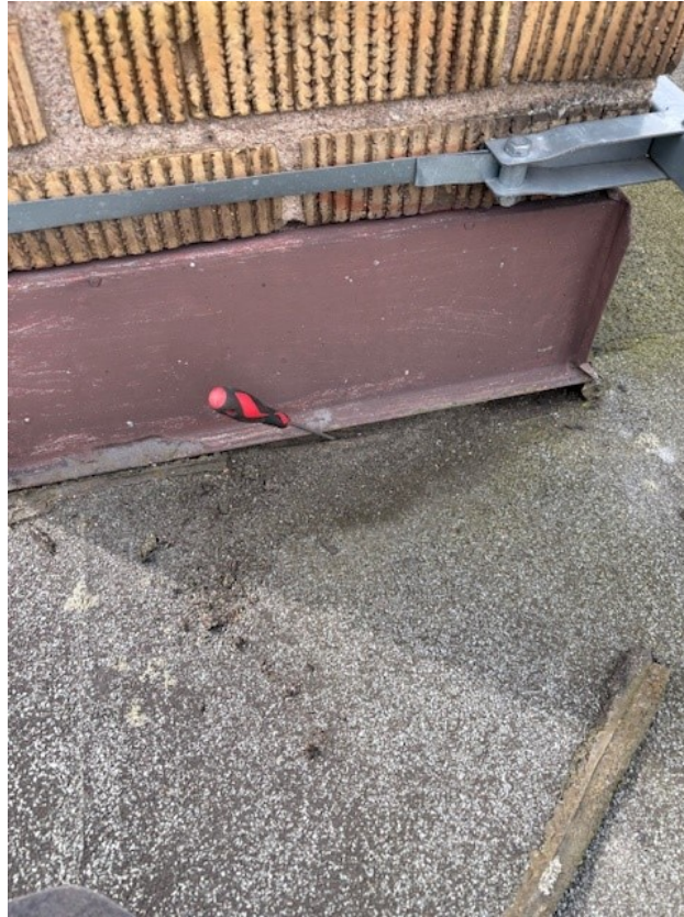
Mindre otätheter mot murstocken.