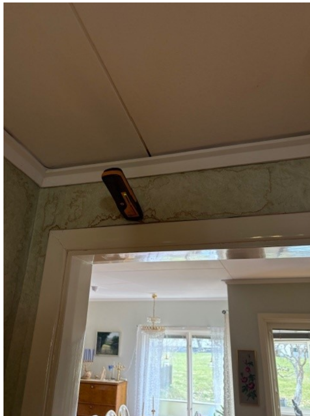
Fuktmätning i hallvägg.