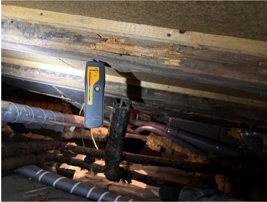
Fuktmätning i torpargrunden.