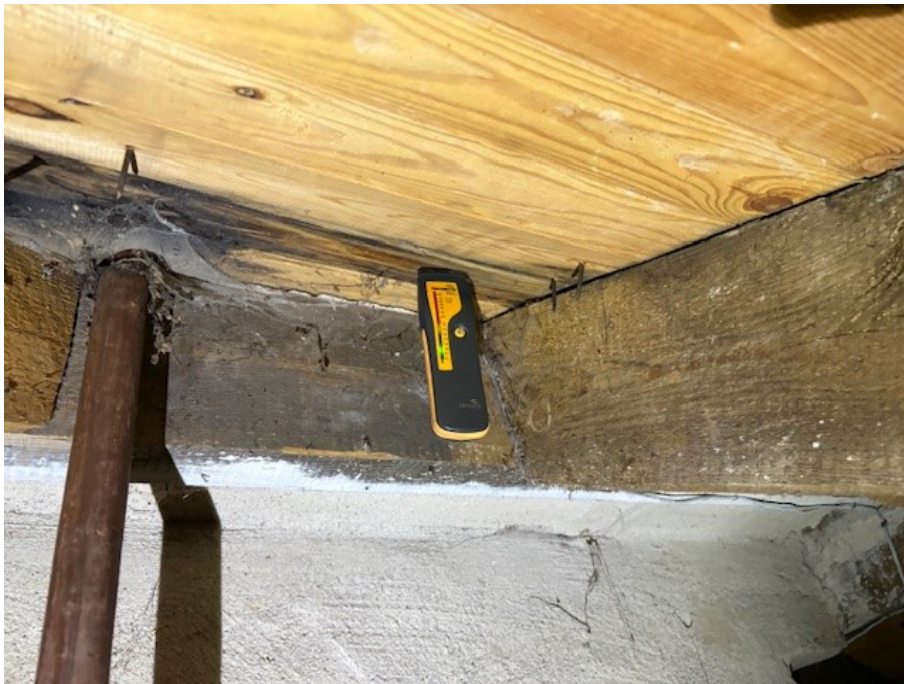
Fuktmätning på vind gällande ursprunglig del.