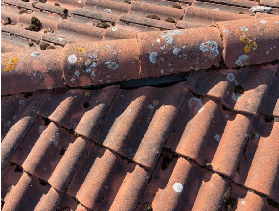
Takpannor på tillbyggnad som glidit ur sitt rätta läge (ej förankrade), justerades vid aktuell besiktning.