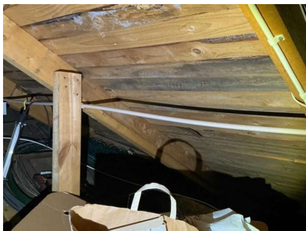
Bild 2: - Utvändigt, Vind, Lokalt på vinden noteras det mikrobiell påväxt på underlagstaket...