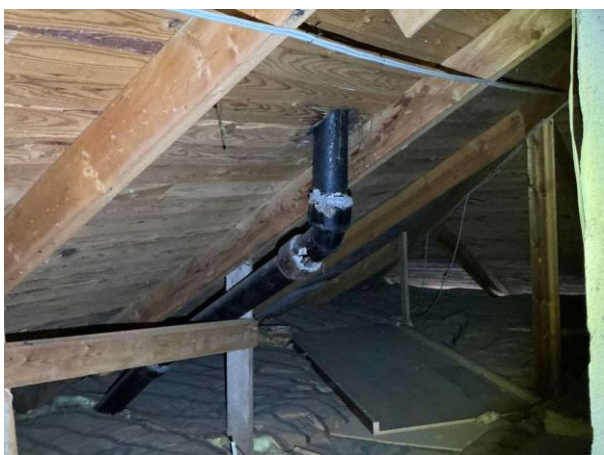
Bild 3: - Utvändigt, Vind, Lokalt på vinden noteras det mikrobiell påväxt på underlagstaket...