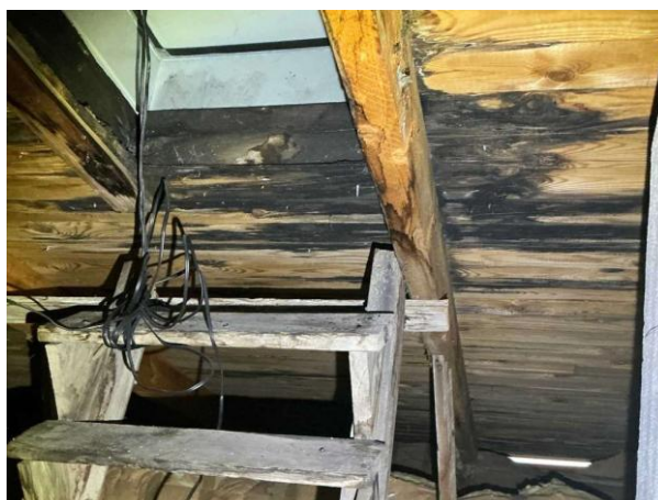
Bild 4: - Utvändigt, Vind, Lokalt på vinden noteras det mikrobiell påväxt på underlagstaket Rötskador noteras på underlagstaket