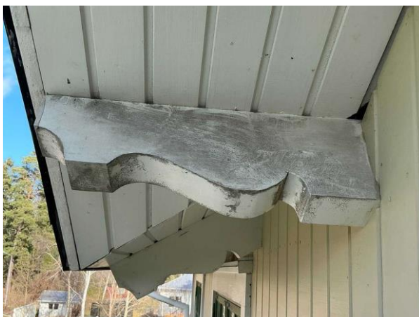
Bild 2: - Utvändigt, Yttertak, Taket är besiktat i anslutning till takfot då det saknas glidskydd för stegen Missfärgningar och ...