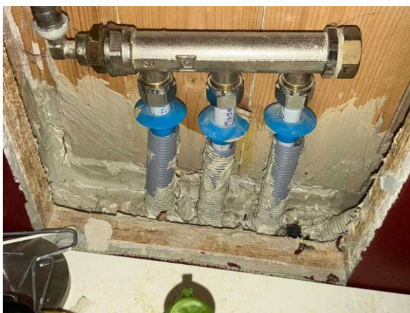
Bild 4: - Invändigt, Entréplan, Inbyggda vattenkopplingar ej utförda i tätt skåp tätskikt finns men läckageindikering saknas Sk d...