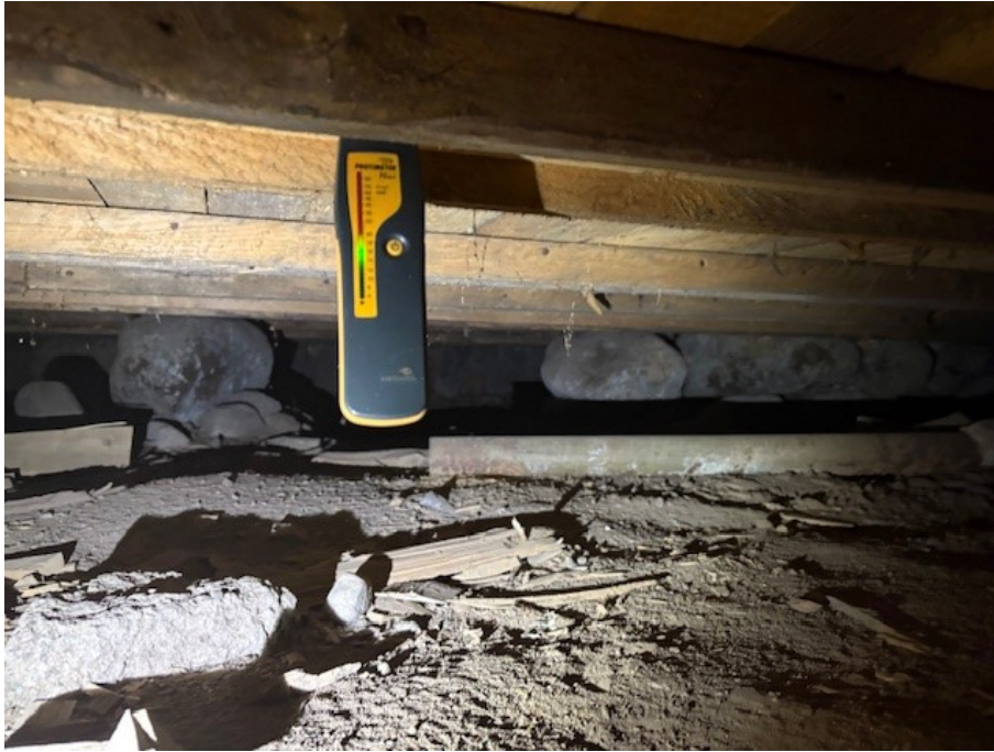
Fuktmätning i torpargrunden.