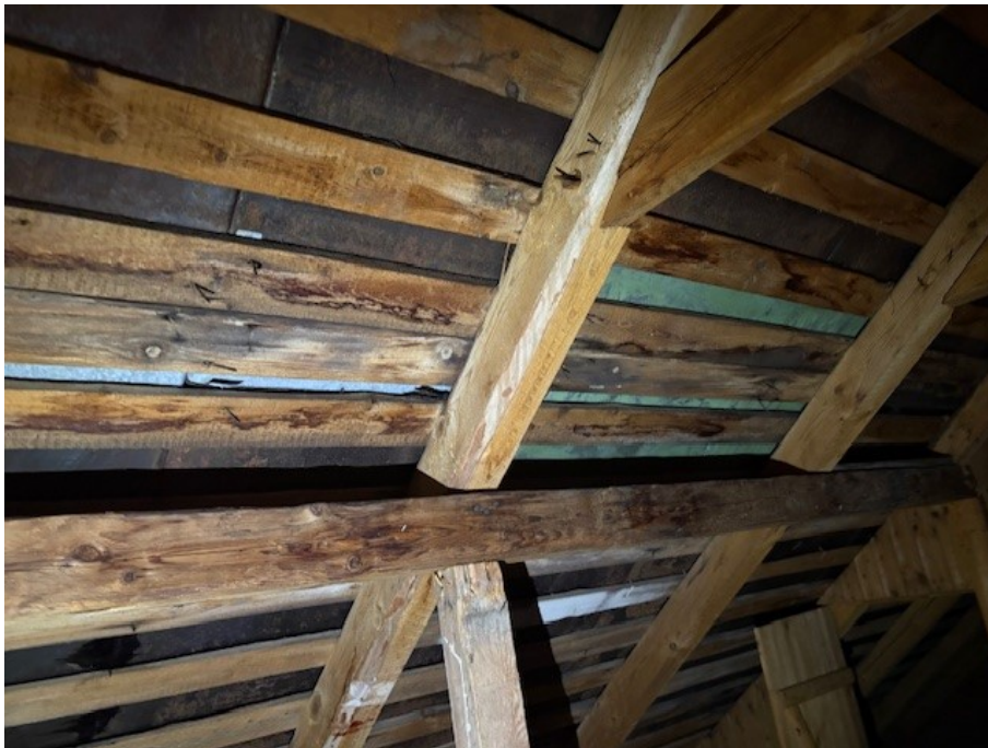
Underlagstak på vind.