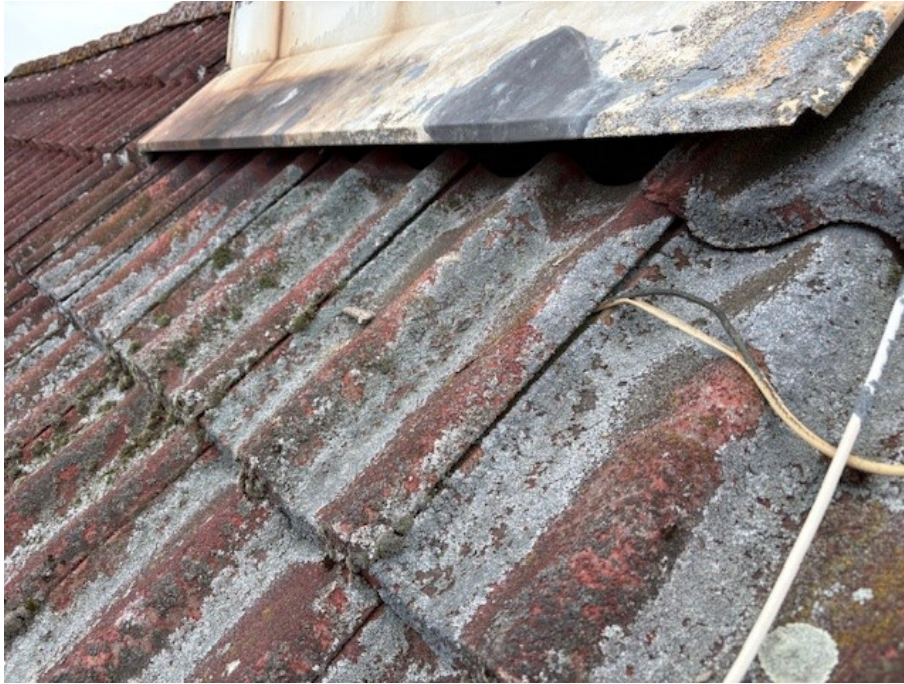
Plåtinklädnad kring skorstenen som tätar/täcker något bristfälligt.