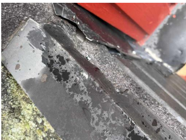
Bild 5: - Utvändigt, Yttertak, Äldre tak Otäta anslutningar noterades ovan papptaket mot fasad samt vid takfoten mot baksidan