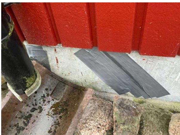
Bild 1: - Utvändigt, Grundmur/Hussockel, Skiva på grundmuren är sprucken (ej besiktat bakom)