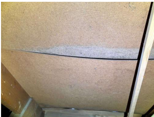
Bild 4: Utvändigt, Vind, Vinden är delvis parallellisolerade /snedtak (delvis saknas vindsutrymme, utgår ur besiktningen)