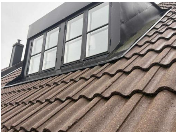
Bild 3: - Utvändigt, Fönster, Färgsläpp finns på fönster Slitet fönster i kupan på övre plan