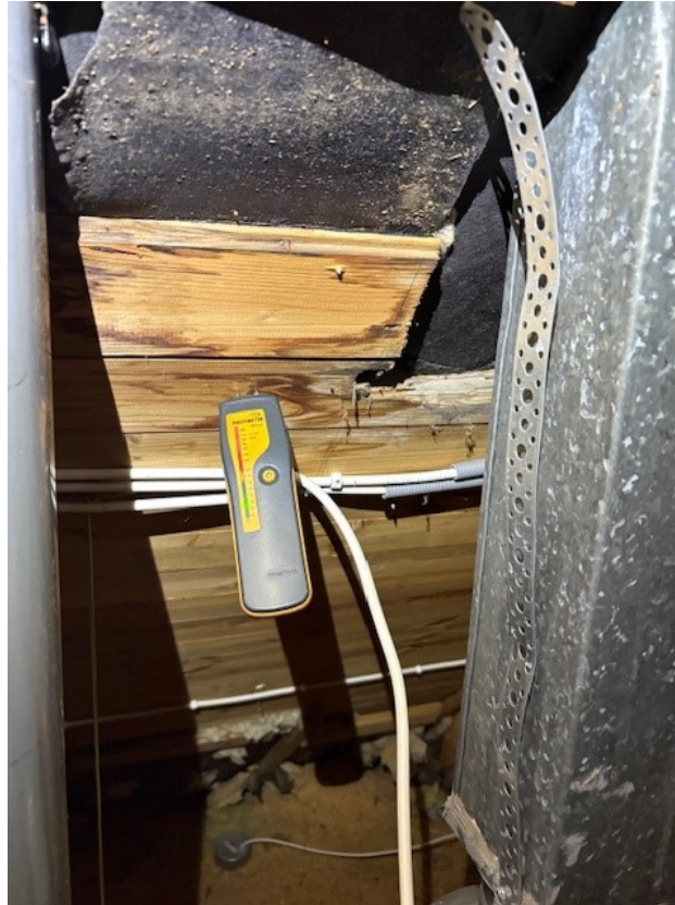
Fuktmätning på vind.