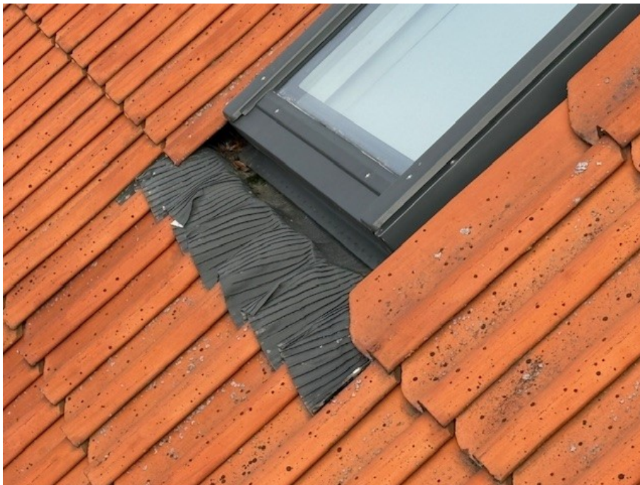
Svacka i veckad plåt/tättningsband under takfönster.