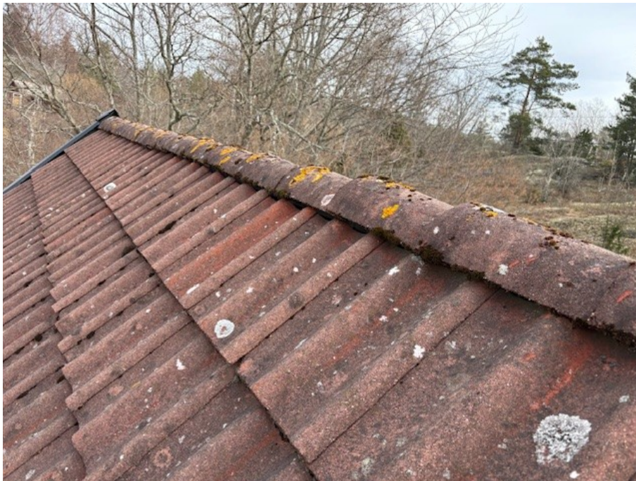
Något bristfälligt överlapp pånockpannor.