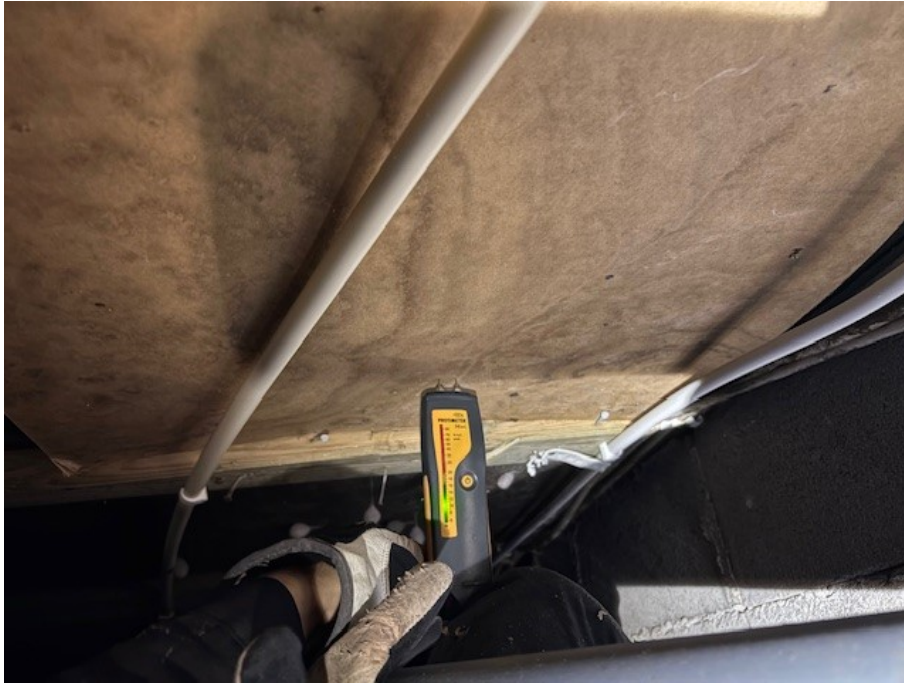
Fuktmätning i krypgrunden under våtrum. Inga förhöjda fuktvärden.