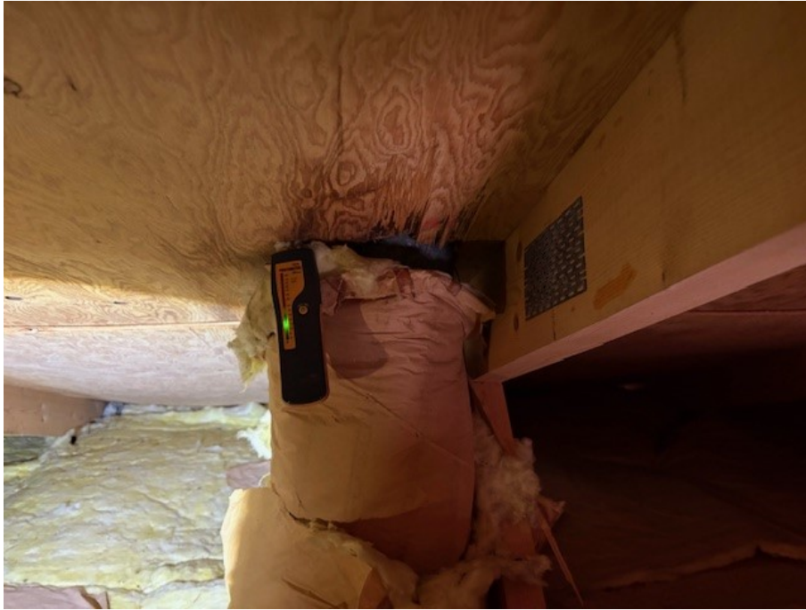
Fuktmätning på vind vid ventilationsgenomföring.