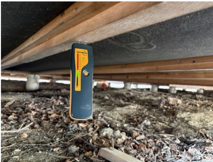
Fuktmätning i plintgrunden.