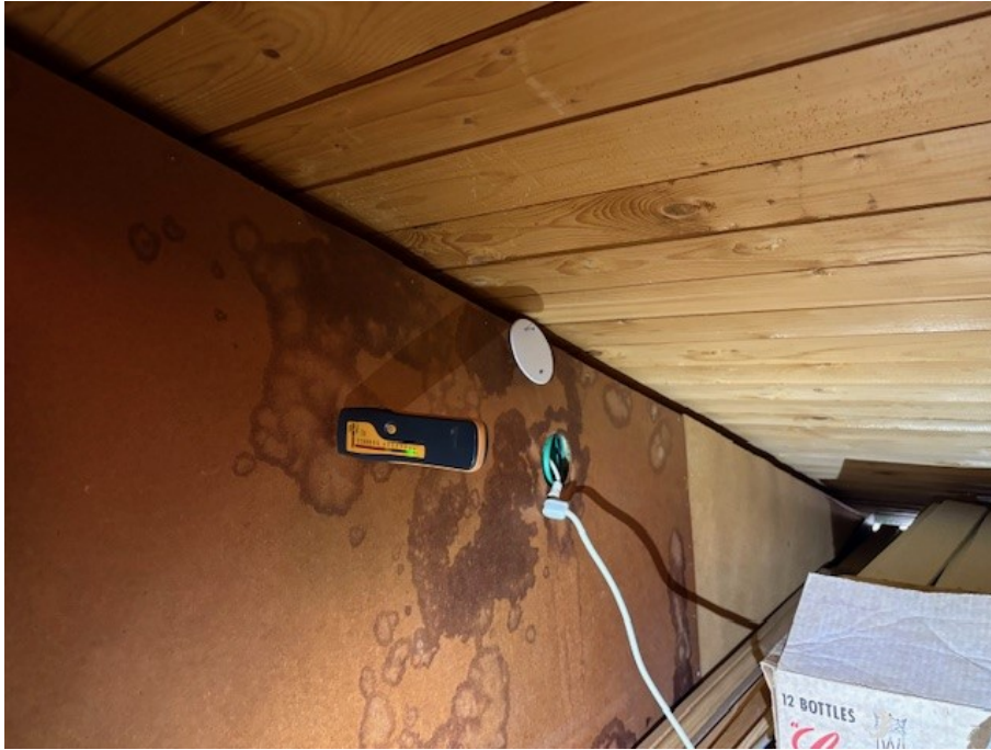
Fuktmätning i fuktfläckar på vind.