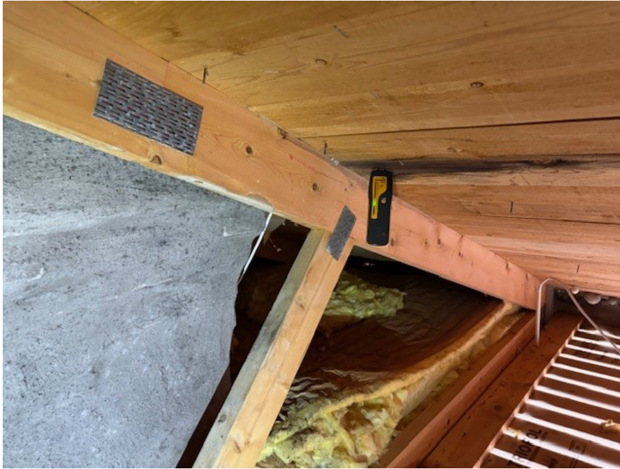
Fuktmätning på vind.