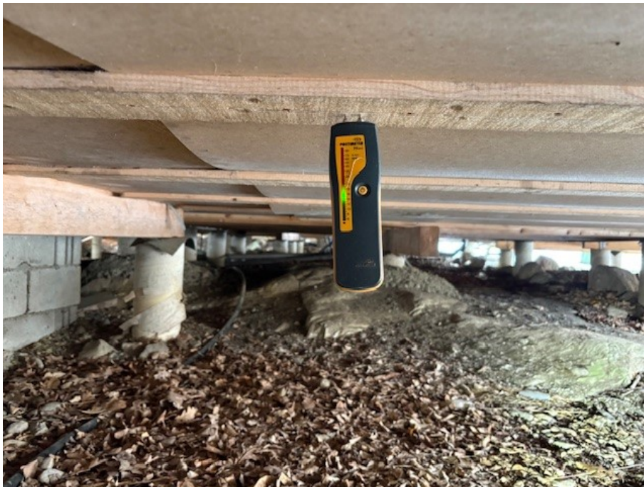
Fuktmätning i plintgrund.