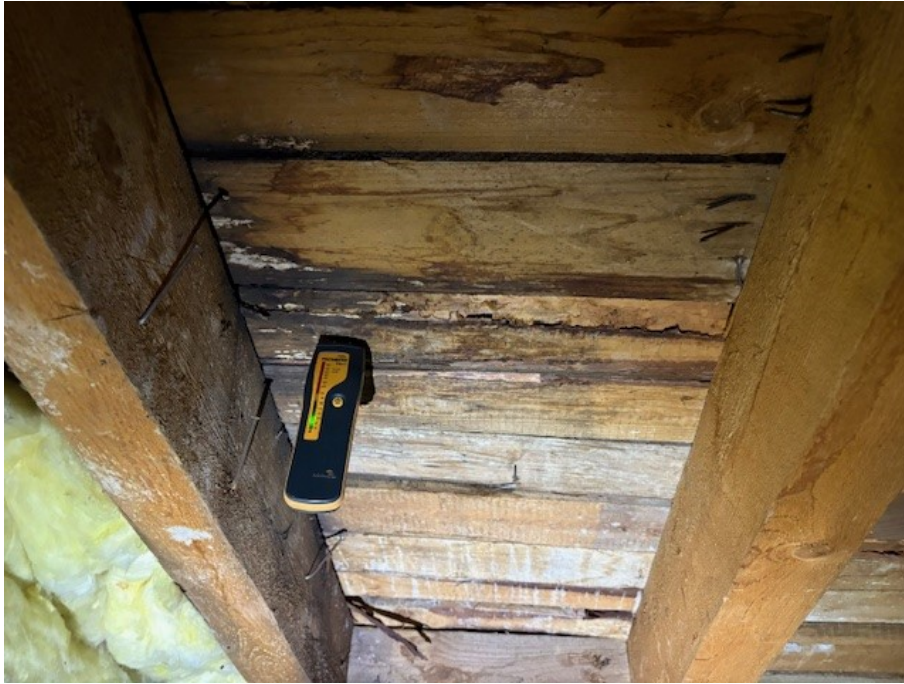
Fuktmätning på vind.