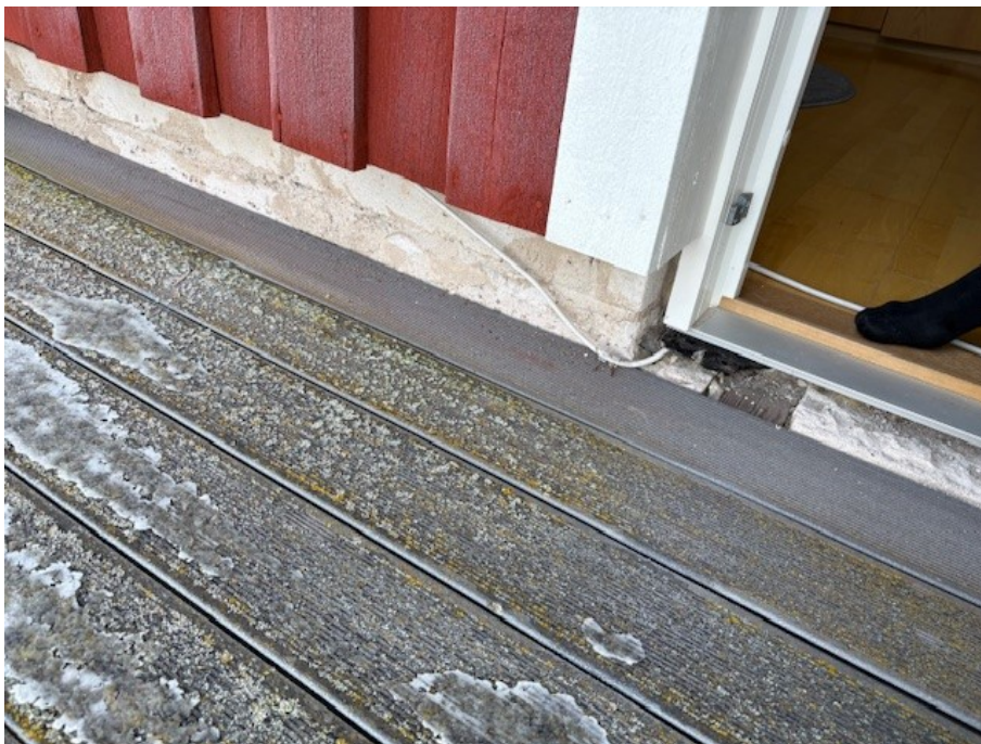
Ej färdigställt mot fasad och tröskel vid balkong, detta är åtgärdat 2026-01-09.