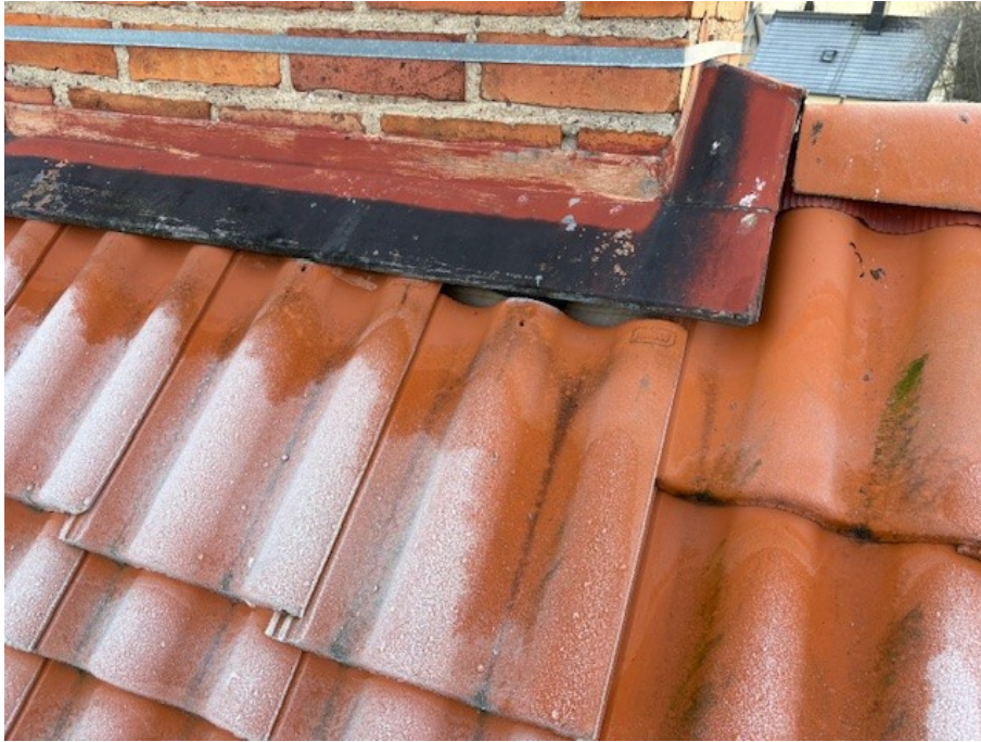
Takpannor som glidit ner vid murstocken, detta är åtgärdat 2026-01-09.